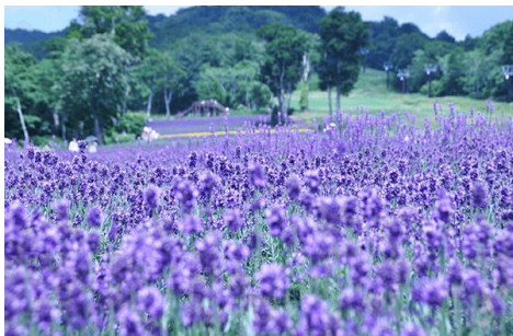
イメージ: たんばらラベンダーパーク