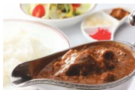
帝国ホテルのカレー（昼食）

大間々 — 休憩2回 — 上高地（散策）・上高地帝国ホテル（昼食） — 6:00 11:00~14:00