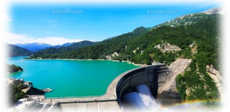
イメージ：黒部ダム